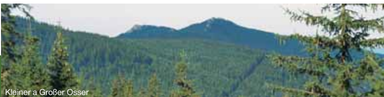
Kleiner a Großer Osse

Großer Osse bildet zusammen mit Kleiner Osse die sog. Brust der Gottesmutter. Im Sattel zwischen beiden Gipfeln steht die künische Kapelle und der alte Grenzstein. Ausblick in die Weite. Zugänglich entweder aus Hamry (7 km) – große Überhöhung, oder lieber von der deutschen Seite.