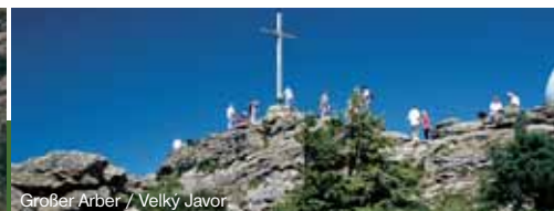
Großer Arber / Velký Javor