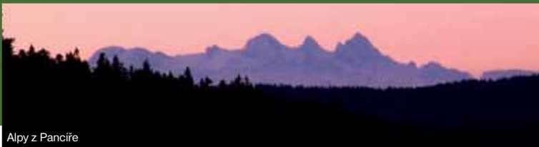
Alpy z Pancíře