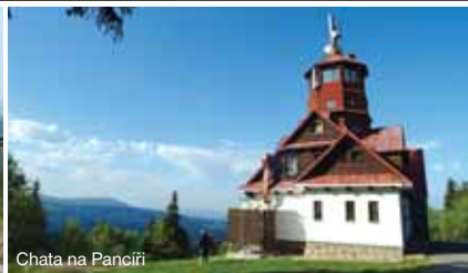
Chata na Pancíři