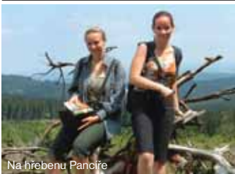
Na hřebenu Pancíře