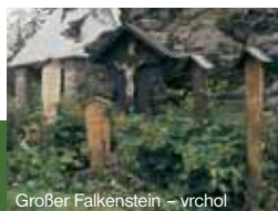
Großer Falkenstein – vrchol

Grosser Falkenstein, 1315 m ü.d. M. – Gipfel mit Berghütte. Eingeschränkter Ausblick von dem Gipfel. Auch hierher kann man nur zu Fuß gelangen (z. B. aus Zwieslerwaldhaus durch den Urwald und an den Wasserfällen vorbei) oder mit dem Fahrrad auf dem Radweg Nr. 7 von dem Grenzübergang im Ferdinandstal, es ist jedoch lohnenswert. Die Umgebung des Falkensteins ist ein großer Naturgarten.