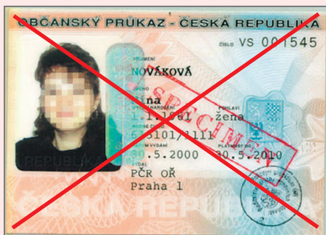
Občanský průkaz bez strojově čitelných údajů

Vyměňte si svůj občanský průkaz bez strojově čitelných údajů již nyní!