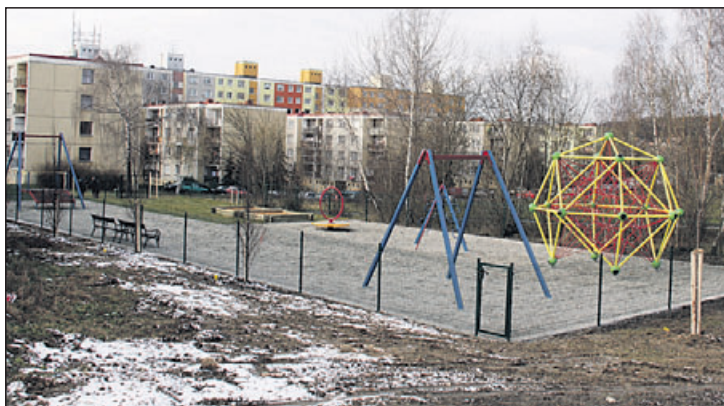
Nové dětské hřiště Na Rybníčkách v Klatovech.