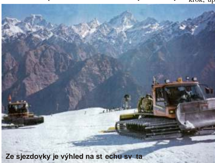
Ze sjezdovky je výhled na st echu sv ta

Situace se ani další dny nem nila. Po dvou dnech se nám kone n poda ilo navázat spojení s velvyslancem a seznámit ho se situací. B hem t chto dní se na letišti postupn shromáždilo na dva tisíce sn žných trose ník z celého sv ta. Mnohým