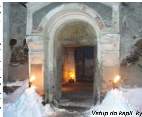
Vstup do kapli ky