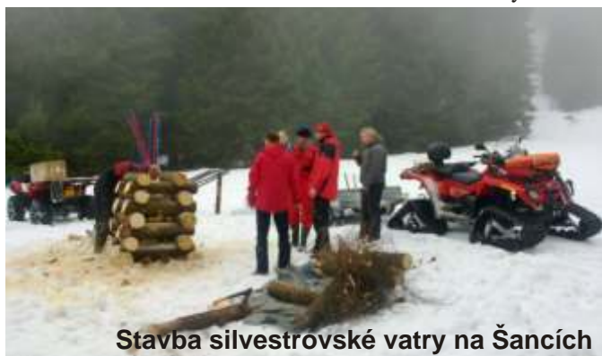
Stavba silvestrovské vatra na Šancích

Tímto p áním se rozlou ila Horská služba Šumava a šumavští lyža í na tradi ním sjezdu sjezdovky Šance s pochodn í na Špi áku 31. prosince 2010. Historie silvestrovského sjezdu sahá až do roku 1948, kdy byla na šumavském