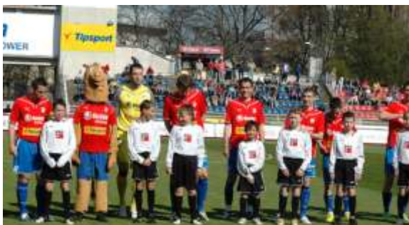
Nástup s fotbalisty Viktoria Plzeň