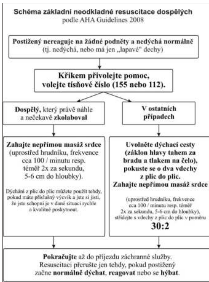
Schéma první pomoci: P evzato z www.zachrannasluzba.cz